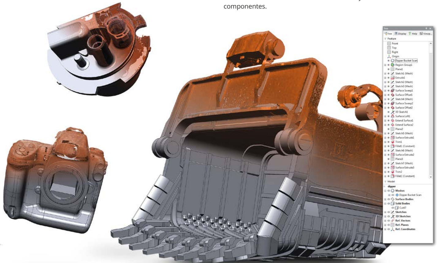
Un modelo sólido paramétrico creado en Geomagic Design X

Ahorre tiempo y dinero al modelar piezas según su construcción y según diseño. Transforme un modelo CAD existente para que se ajuste a sus escaneos 3D. Reduzca los costes de repetición de la herramienta usando geometría de piezas reales para corregir su CAD y la eliminación de problemas de recuperación de piezas. Reduzca los costosos errores relacionados con el encaje deficiente con otros componentes.